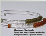
Monique Swinkels Spring met smelt koper / bevestiging, houdingskralen en geleide kralen