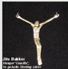
Jits Bakker Finger "Crucif" te gebruiken Sterling zilver