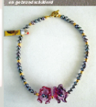
Lianne Evers grijze zandwaaipans / vergulde beertjes / handgemaakte glazen schelpjes