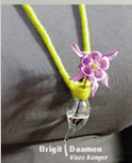
Brigit Daamen Diamant Kraag

Sieraden in de bij Restaurant 'De Middenschip' Hooftstraat 46 te Epe tel: 078 619 333 www.de-middenschip.nl 3-gangen lunch € 22,50 € 22,50 inclusief Borrel en water in noodzakelijk.