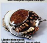
Lidette Middelfoot Broche, zilver met agaat, beza en schelp